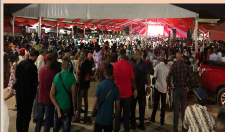
Feesttent te Lelydorp

Op 3 februari 2024 werd ter ere van de 65e verjaardag van VHP-voorzitter Z.E. president Santokhi een zeer geslaagde feestelijke bijeenkomst georganiseerd in zijn woonplaats Lelydorp. De president en zijn echtgenote waren zichtbaar verrast door de enorme opkomst en de geweldige organisatie van deze mooie avond. Duizenden mensen zijn van heinde en verre gekomen om de president te feliciteren en om deelgenoot te kunnen zijn van deze prachtige avond.