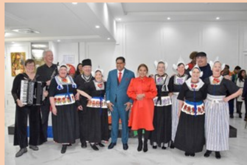
President Santokhi op event VHP-Nederland te Hoofdbestuur

De kracht van de Surinaamse diaspora en VHP-Nederland mag daarom niet onderschat worden. Bijna elke Surinamer heeft een naaste verwant in Nederland wonen, en de band is zo hecht dat het van invloed is op het dagelijkse leven van het Surinaamse volk en zeker ook op het electorale stemgedrag. Een goed gemobiliseerde diaspora is in staat elke willekeurige politieke partij in Suriname aan een verkiezingswinst te helpen.