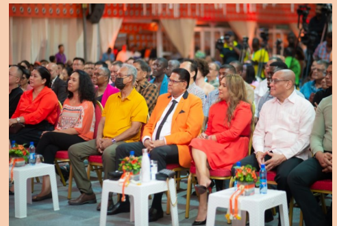
President met first lady en partijgenoten

In een bomvol Roeli's Event Venue hield de VHP op 16 januari haar feestelijke dankdienst ter gelegenheid van 75 jaar VHP. VHP-voorzitter Z.E. presi-