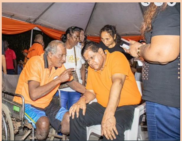
Voorzitter Chan Santokhi: een luisterend oor

Samen vooruit. Met lef, transparantie en hoop